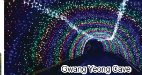
Gwang Yeong Cave